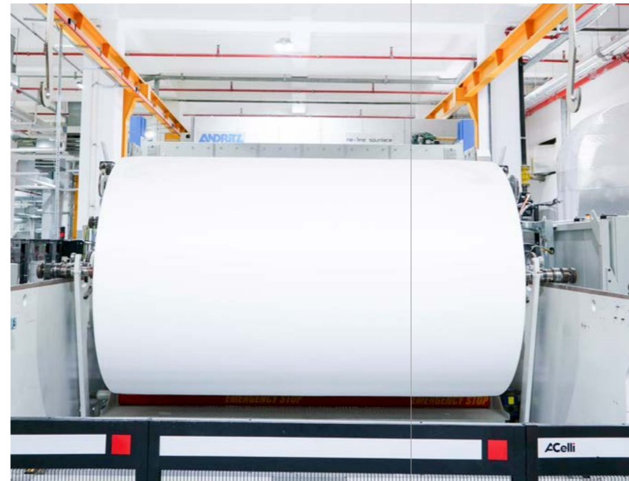
收卷设备:大卷可直接用于后续的分切生产线