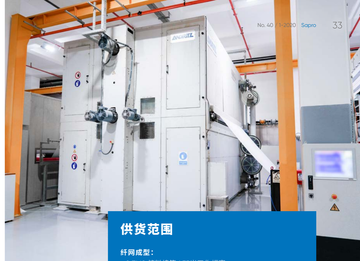
带热量回收功能的neXdry 烘干机

如果是琥珀色,我们会采取相应的行动;我们的计划是永远不要停机。Metris UX帮助我们做到了这一点。”