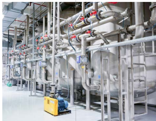
由安德里茨设计的高效过滤系统

2019年3月Metris UX系统安装并应用在Sapro的水刺生产线上。该方案包括使用安装在生产线周围的现有传感器,在需要时安装新的传感器,与用于管理大量流程操作的软件工具链接,从泵和电动机到PID回路。该系统可以使操作员准确地实时查看原材料,能源,水的使用情况以及维修问题,例如过热的泵或需要更换的轴承。