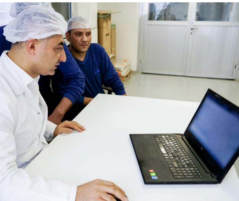
水刺生产线操作员可以一目了然清楚地看到生产率的下降和提高。

“这确实可以提高我们工厂未来的效率。甚至连业界专家都不能预测,但Metris UX却可以。我们可以实时准确地看到正在查看的内容,在线趋势,数据,