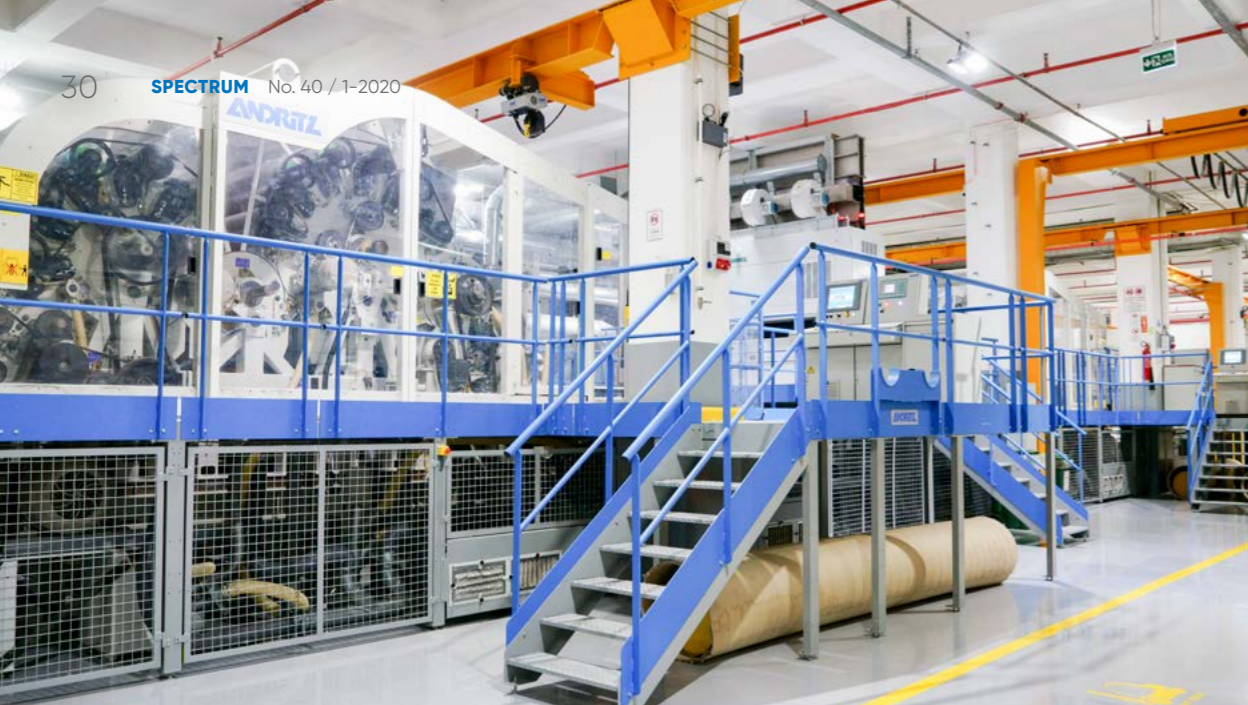
用于卫生擦拭布的水刺生产线