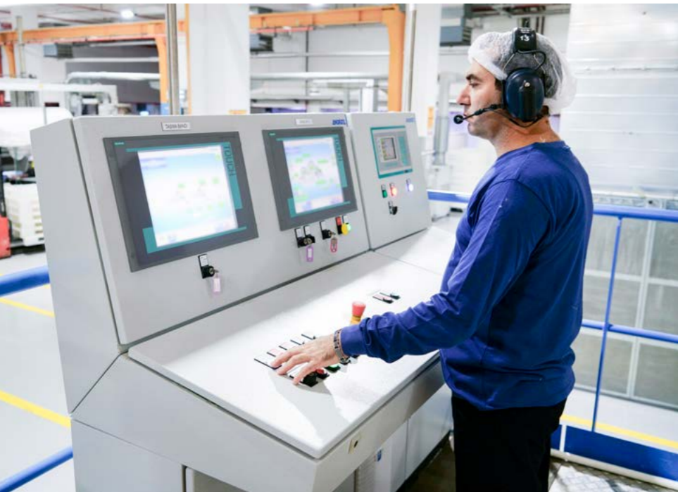
工艺过程监控系统