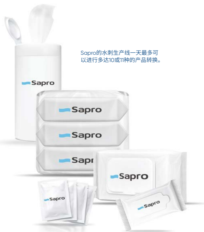
Sapro的水刺生产线一天最多可以进行多达10或11种的产品转换。