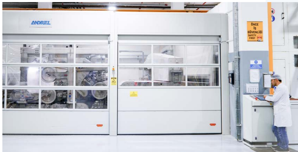
带neXjet水刺头的JetlaceEssentiel水刺缠结系统是目前非常先进的

“Zincirkiran继续说道：“所以，你可能会认为这是一个利基市场，是卫生行业的一个增值领域，但实际我们与其他任何行业一样，都受制于相同的市场价格条件；我们必须找到自己创造利润的方法，这就是为什么我们必须在我们所做的一