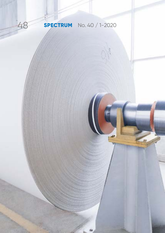
一号机和二号机的合计产能达每年24万吨包装纸和纸板。