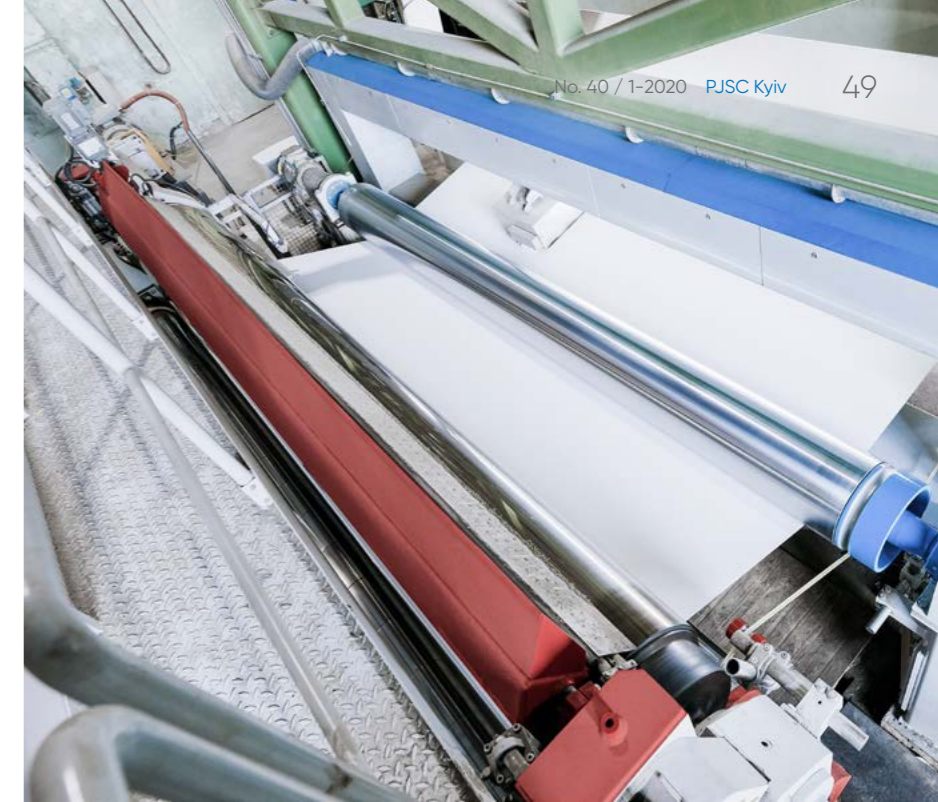
安德里茨提供的全新PrimeCal硬压光机在开机后很快就达到了约定的平滑度标准。